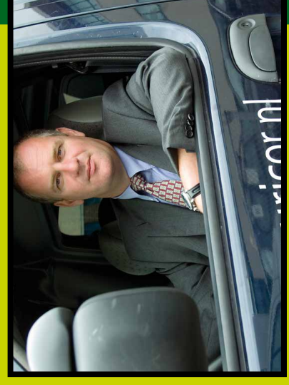
Securicor : ...

Ze werden geplaatst in een fulltime voorschakeltraject: naast lessen voor de vaktaal en het verwerven van sociale vaardigheden behelste dit ook informatie over het beroepsbeeld en de beroepsinhoud – overgebracht door mensen van de werkvloer. Hierna volgde voor de kandidaten het opleidingstraject tot beveiligers, en tijdens de opleiding werden ze al in dienst genomen door Securicor. Het NCB ondersteunt niet alleen voor en tijdens de plaatsing, maar verleent waar gewenst ook nazorg.