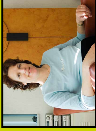
Delta Lloyd

Delta Lloyd heeft een visie die is gekoppeld aan hun strategisch beleid. Daarmee ligt er een stevige