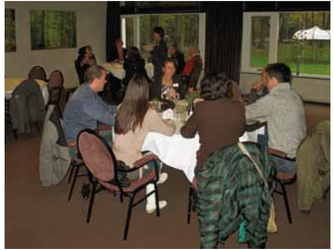
'Prettig gesprek' in volle gang.