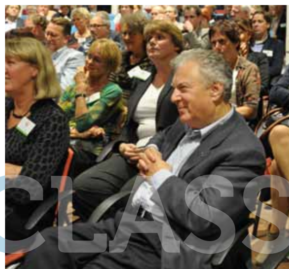
Professor Arnold Heertje luistert naar deelnemers.

bliek- private samenwerking in de MUG-gemeenten faciliteert hierin en is hiermee uniek. Het vraagt van iedereen Inzicht, Overzicht, Moed", varieerde hij gedreven op het bekende 'ge-loof, hoop en liefde'.