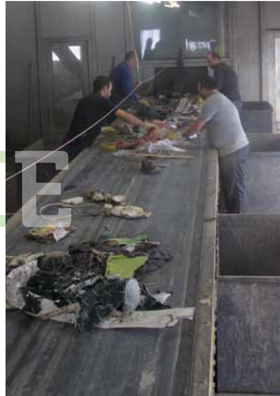
Vuilsorteerband Van Kesteren.

De kracht van de aanpak ‘Nieuw Werk’ zit in de gelijkwaardige samenwerking tussen de ondernemers, de gemeente en de kandidaat. Of zoals Jetta Klijnsma het zei: “Elkaar echt in de ogen kijken, voorbij de anonimiteit”. Ze was na afloop zeer onder de indruk van deze innovatieve aanpak. “Het past mooi in het sociaal akkoord, en ik word hier heel vrolijk van.”